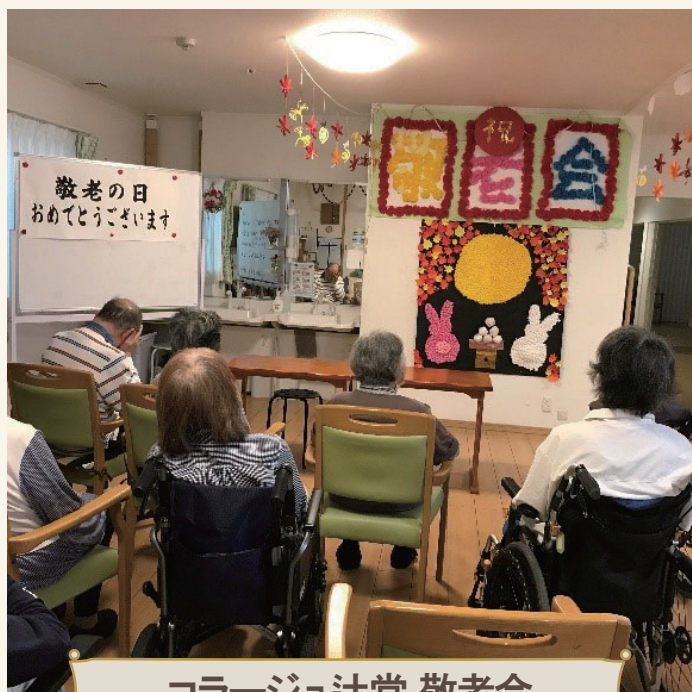
コラージュ辻堂 敬老会

小規模多機能型居宅介護事業とは、人生の晩年をご自分の住み慣れた町で、ご家族やご友人達に囲まれて暮らせるよう、サービスを組み合わせて提供する在宅介護サービスです。