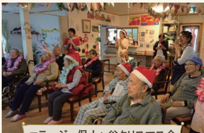
コラージュ保土ヶ谷クリスマス会

季節や状況に応じた様々なイベントを開催してきました。 今後も感染対策などをしっかり行い、ご利用者様が楽しめる企画をしていきます。