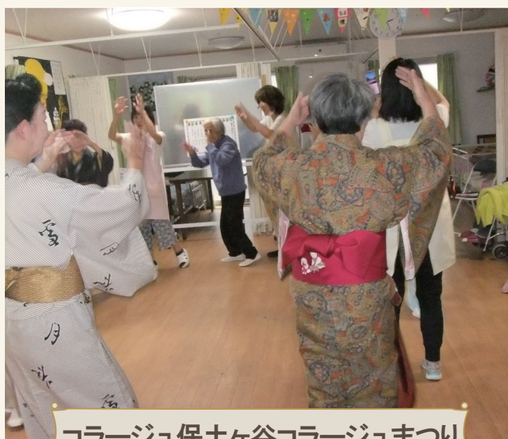
コラージュ保土ヶ谷コラージュまつり

季節や状況に応じた様々なイベントを開催してきました。 今後も感染対策などをしっかり行い、ご利用者様が楽しめる企画をしていきます。