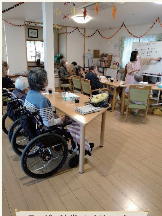
コラージュ辻堂 レクリエーション